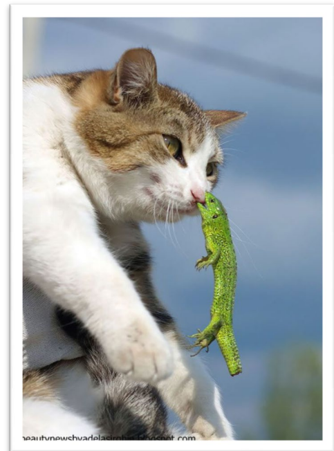
↑ゆたんしてかまれた ねうねうセンパイ